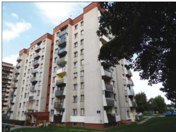
W wieżowcu przy ul. Kombatantów 6 w Krakowie jest już ciepła woda bez piecyka