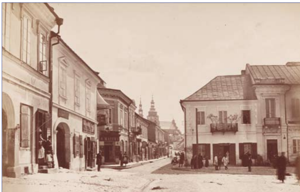
Rynek w Kielcach 1885 r.