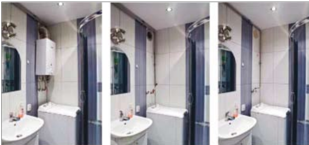
Od lewej widok łazienki z piecykiem gazowym i po instalacji c.c.w. – bez piecyka. Instalacja w klatce schodowej

Proces zmiany systemu przygotowania ciepłej wody użytkowej wymaga wykonania niezbędnego zakresu prac, jednak nie ma mowy o żadnej dewastacji, a sama operacja przełączenia