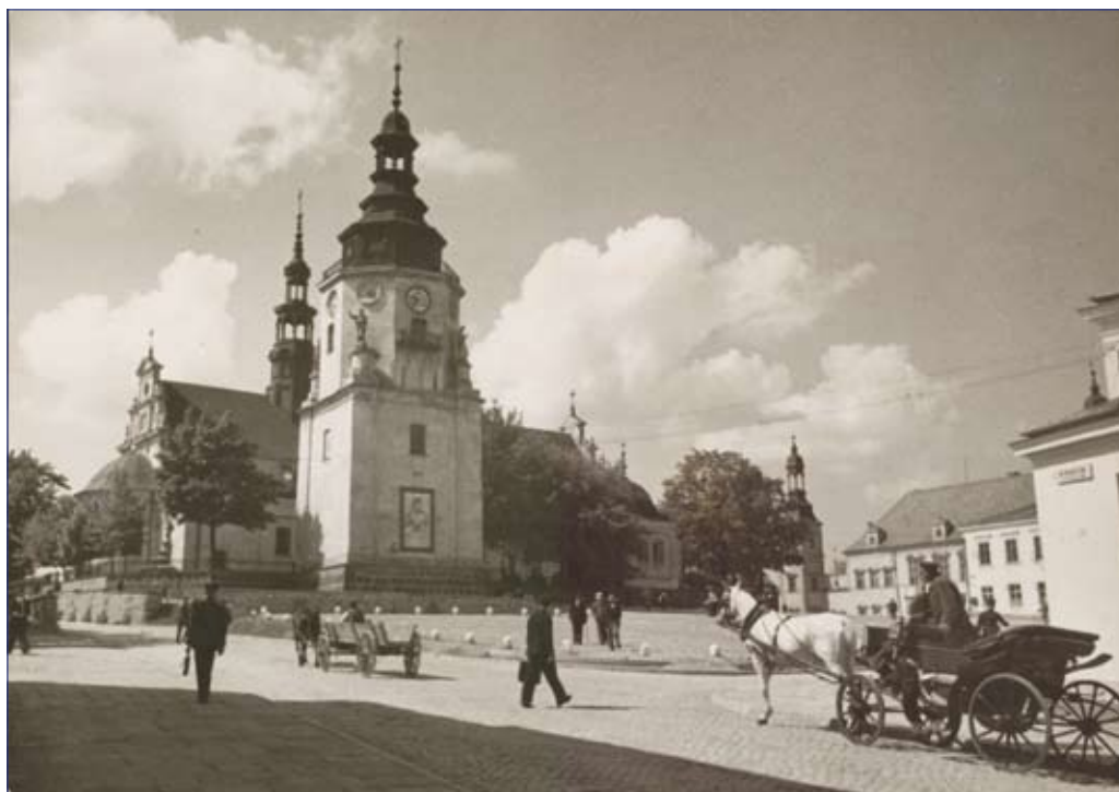
Kościół katedralny w Kielcach w 1936 r.

Po przerwaniu ceremonii kościelnej, na podium wyszedł