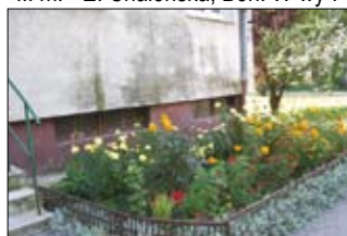
Wyróżnienie - Boh. Warszawy 7