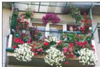
I m. - J. Sabat, Karłowicza 9

W Osiedlu „Sady” Komisja przyznała trzy nagrody za ogródki przydomowe, które w znaczący sposób wpłynęły na estetykę budynków i przez całe lato zachwycały przechodniów swoim wyglądem. Oprócz walorów estetycznych pełniły również funkcję edukacyjną dla przedszkolaków tym bardziej, że w ogródku