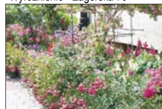
Wyróżnienie - ogródek, Zagórska 64