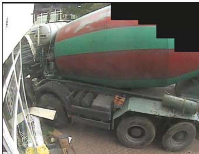
Ul. Wojewódzka 2: samochód cementem jechał i ... wjechał w budynek, rozbijając ścianę. Zdjęcia z monitoringu.