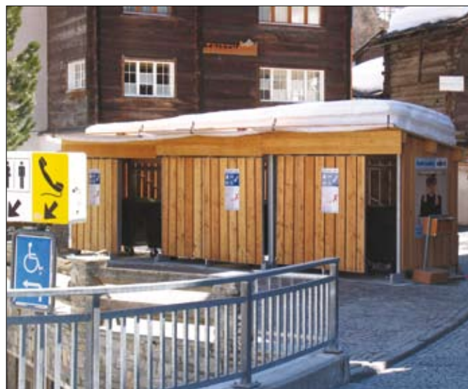
Altanka śmietnikowa w Zermatt w Szwajcarii. Wszystkie pojazdy w tym uzdrowisku (także policja i śmieciarki) mają silniki elektryczne

Możliwe się to stanie między innymi dlatego, że firma taka będzie wywozić odpady z minimum 1/5 miasta, co spowoduje znaczące obniżenie kosztów odbioru. Skończą się nieracjonalne sytuacje widywane obecnie, gdzie do odbioru odpadów z sąsiednich posesji, czy altanek śmietnikowych podjeżdżają dwie śmieciarki z różnych firm. Radykalna zmiana tras przejazdów samochodów odbierających odpady, jak również zwiększenie ilości odpadów odbieranych na danym terenie spowoduje znaczące oszczędności. Środki te będą spożytkowane na tworzenie punktów selektywnej zbiórki odpadów.