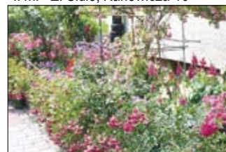
Wyróżnienie - Zagórska 70