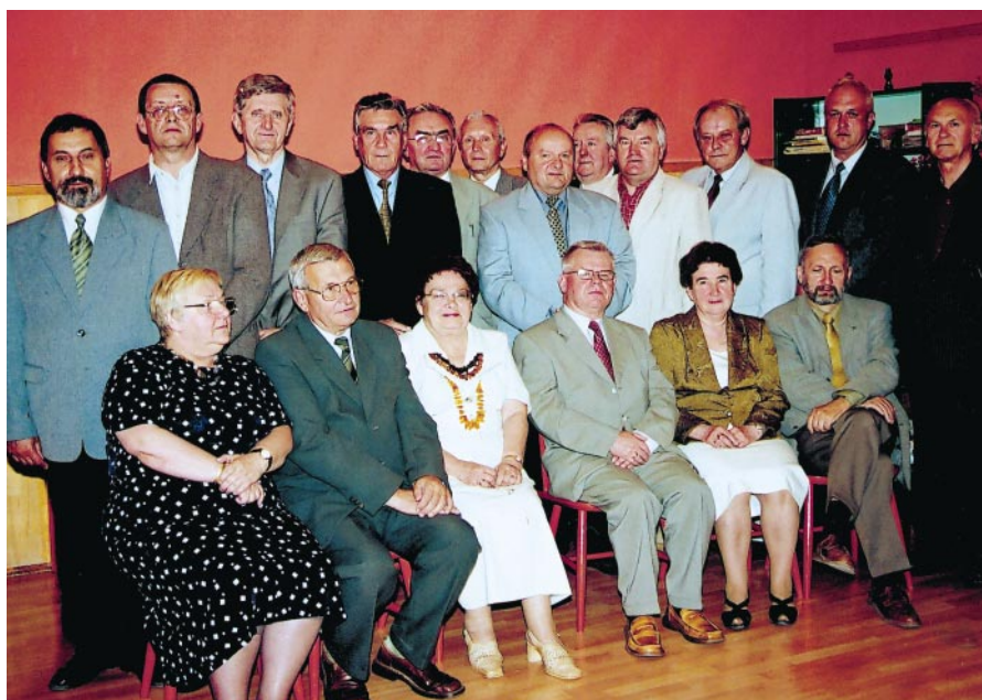
Na pierwszym posiedzeniu Rada Nadzorcza ukształtowała następujący skład Prezydium: