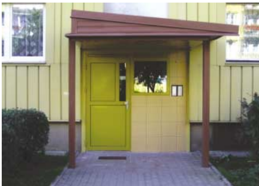
Wejście do budynku przy ul. Dalekiej 23

ści odpisów amortyzacyjnych - 564 tys. zł. Wykonano modernizację kotła w kotłowni Źniwna oraz wymianę sieci w technologii rur preizolowanych w rejonie ulic Wielkopolskiej i Śląskiej.